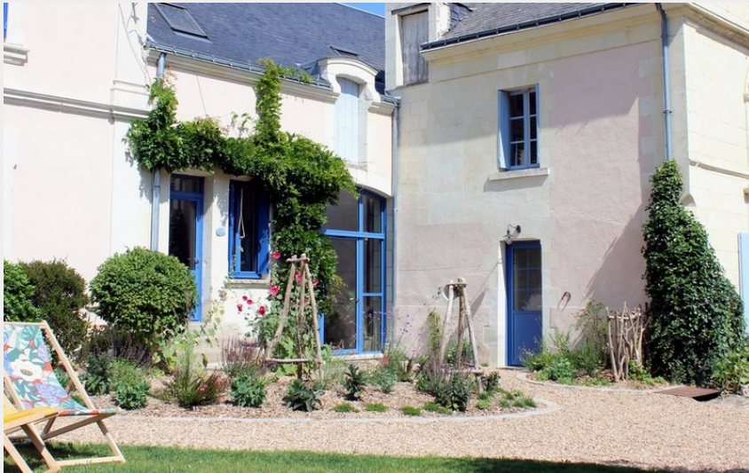
Crédit : rivarennnes- LA BURONNIÈRE-1-Extérieur1 (Cécile Hoarau De Moor)