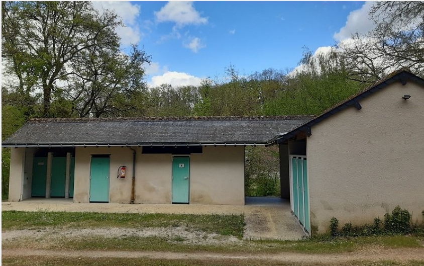
Crédit photo : Bloc sanitaire - Camping de Villaines-les-Rochers (ADT Touraine / Jérôme Huet)