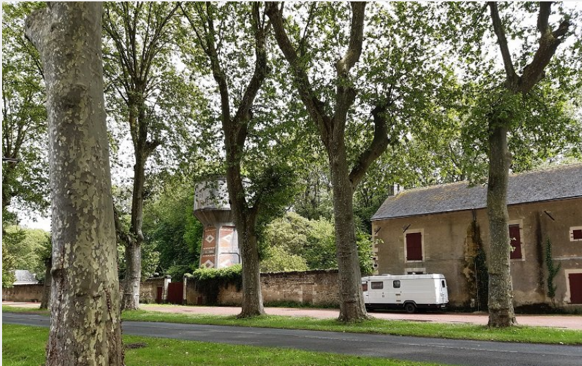
Aire de stationnement camping-car de Richelieu