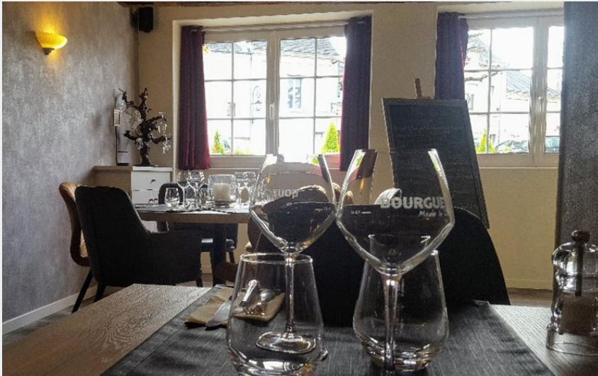
Crédit photo : bourgueil-restaurant-rose-de-pindare (© la Rose de Pindare)