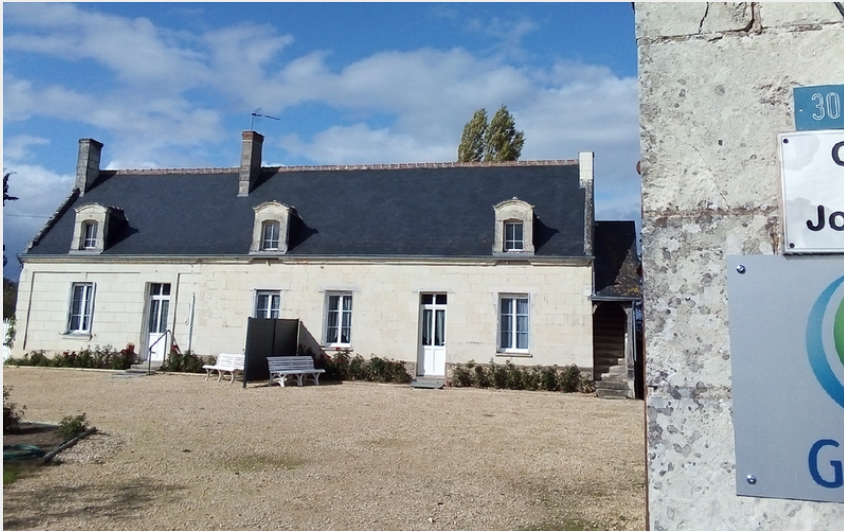
Crédit photo : Chouze sur Loire Gîte du Joncher (1) (Jacqueline et Patrick HUBERT)