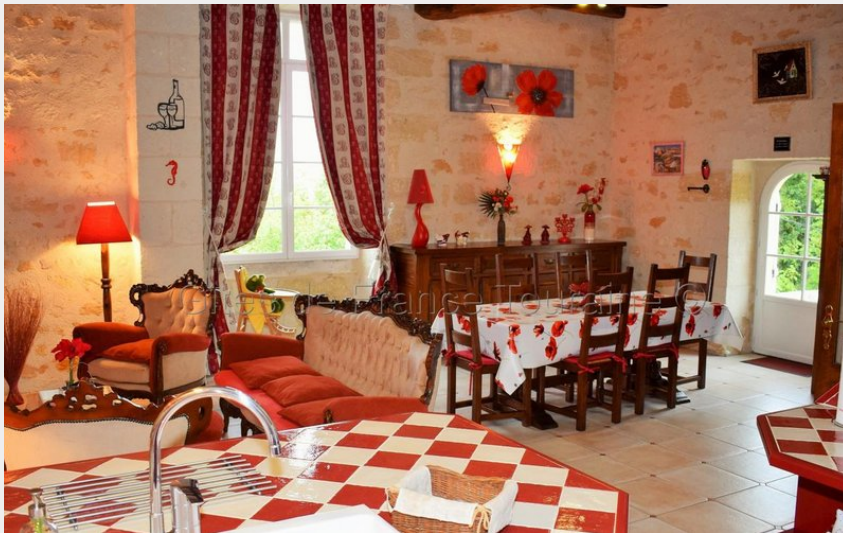
Gaiété de Roche Faucon_2