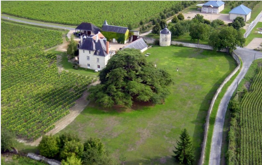
Crédit photo : Château de la Bonnelière - Plouzeau (Hervé Plouzeau)