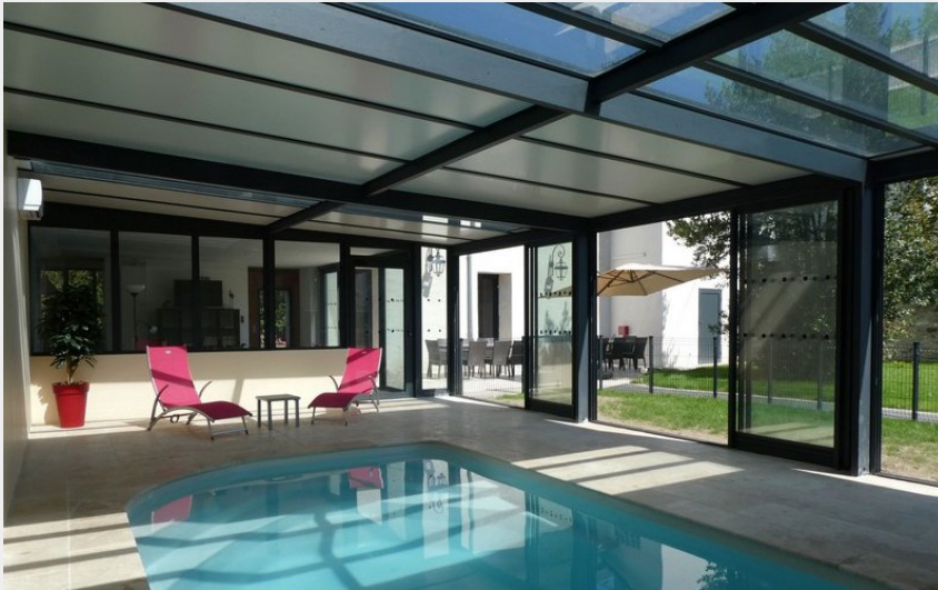
Gîte Cèdre et Charme - Piscine intérieure 1