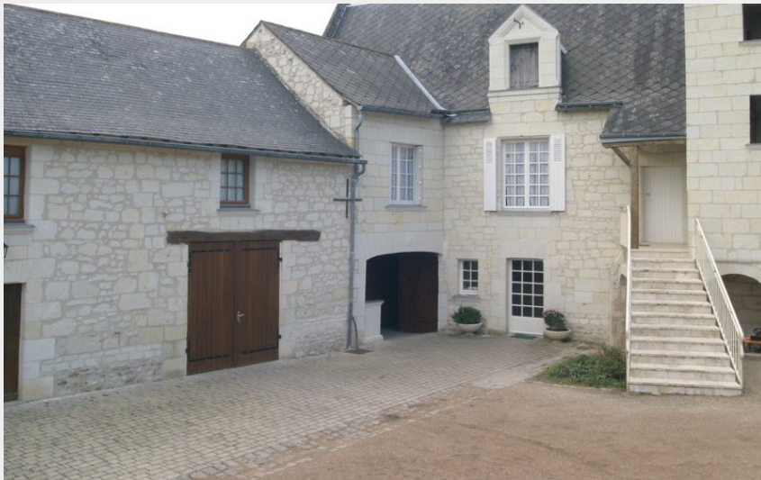
Bienvenue au Domaine du Vieux Bourg