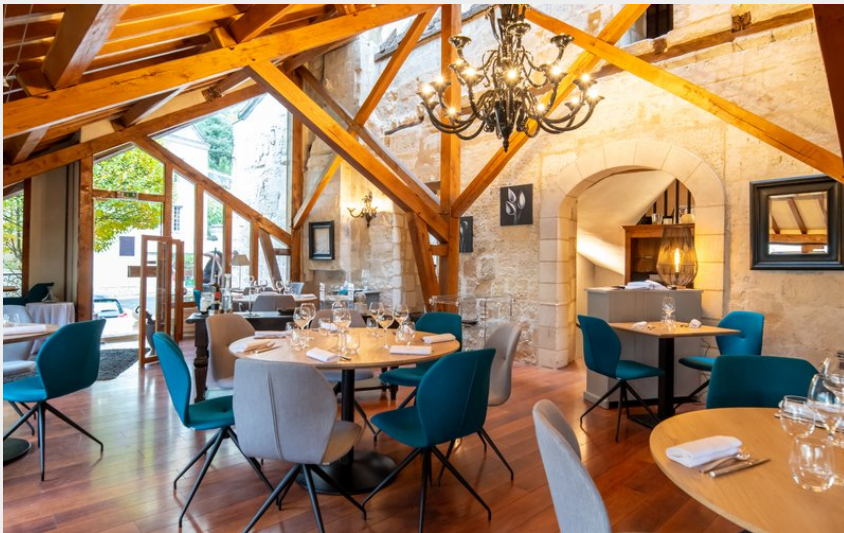
Salle principale du restaurant L'Essentiel