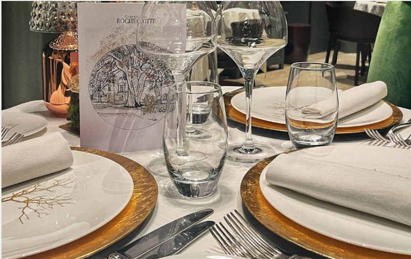
Crédit photo : Réveillon de la Saint-Sylvestre (Lisa Bréard Château de Rochecotte)