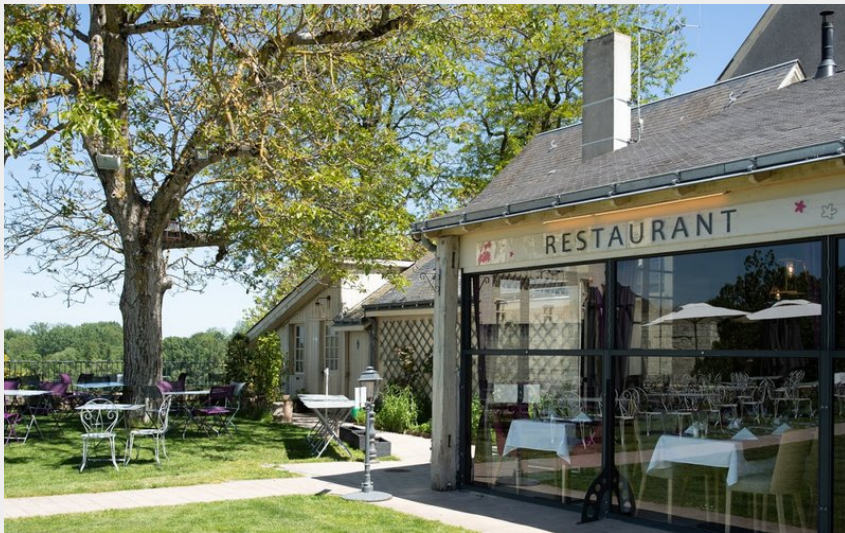
Crédit photo : Extérieur (Dominique ROI - GOOGLE - Restaurant Le Montsorelli)