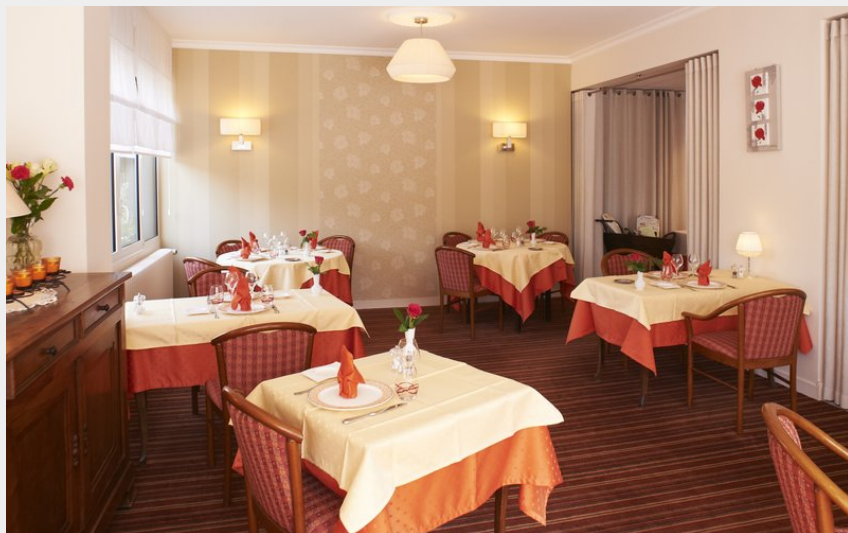
Crédit photo : salle de restaurant (Auberge de la Rose - ECOMOUEST)