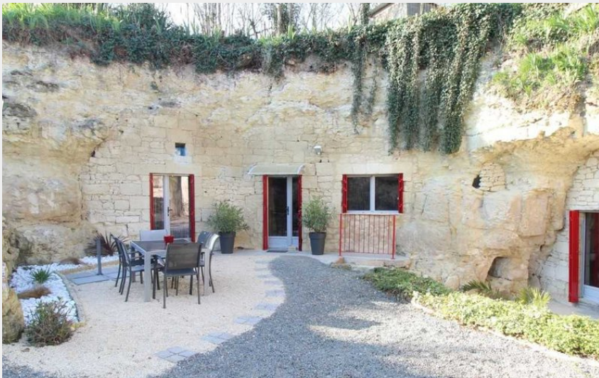
Crédit photo : Le salon pour profiter des beaux jours (Annabelle Martinet)