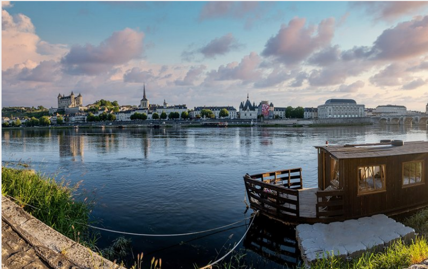
Crédit photo : Le Martin Pêcheur - Loire Evasion (Kazim Kreazim communication)