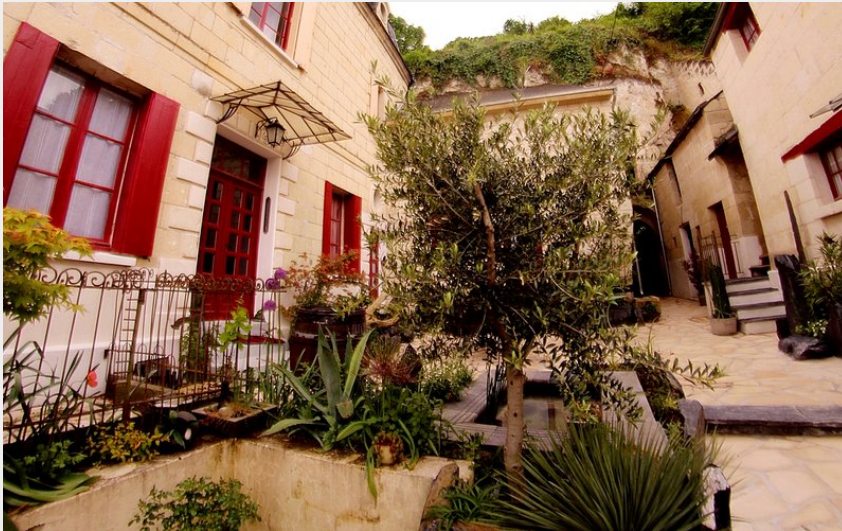
Crédit photo : Vue extérieure (Olivier Schwartz Beaulieu la Source)