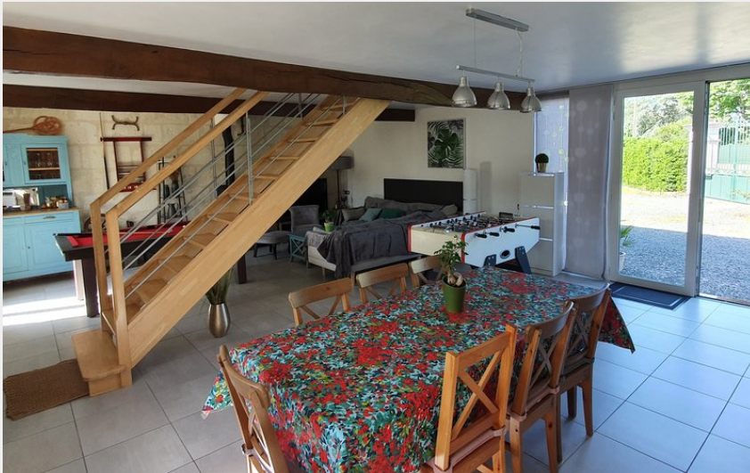
Pièce de vie cuisine/salon