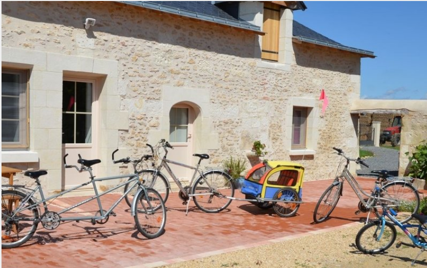
Crédit photo : Vélos à disposition (Maryse et Jean-Claude Chauveau)