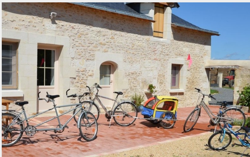
Crédit photo : Vélos à disposition (Maryse et Jean-Claude Chauveau)