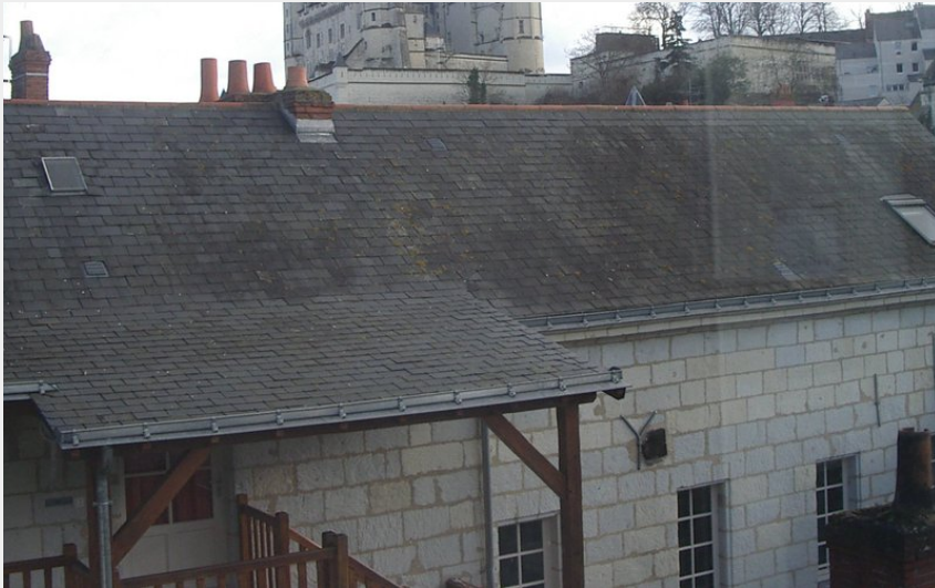
Vue sur le Château