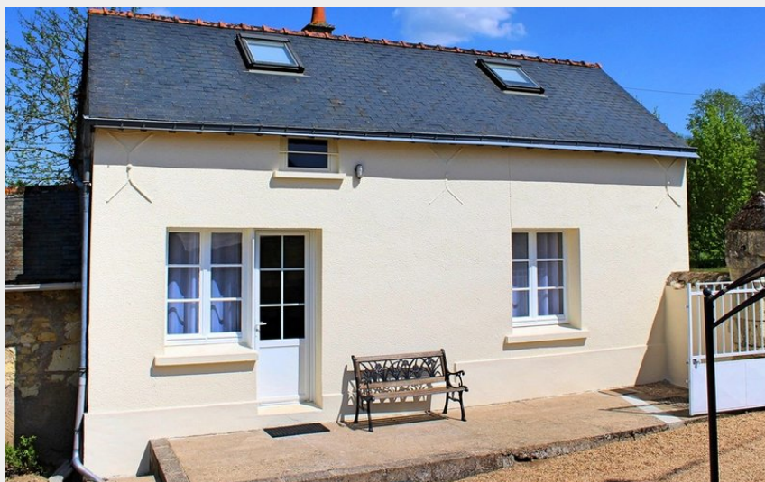
Crédit photo : Façade gîte La croix des chemins (Catherine Taillez)