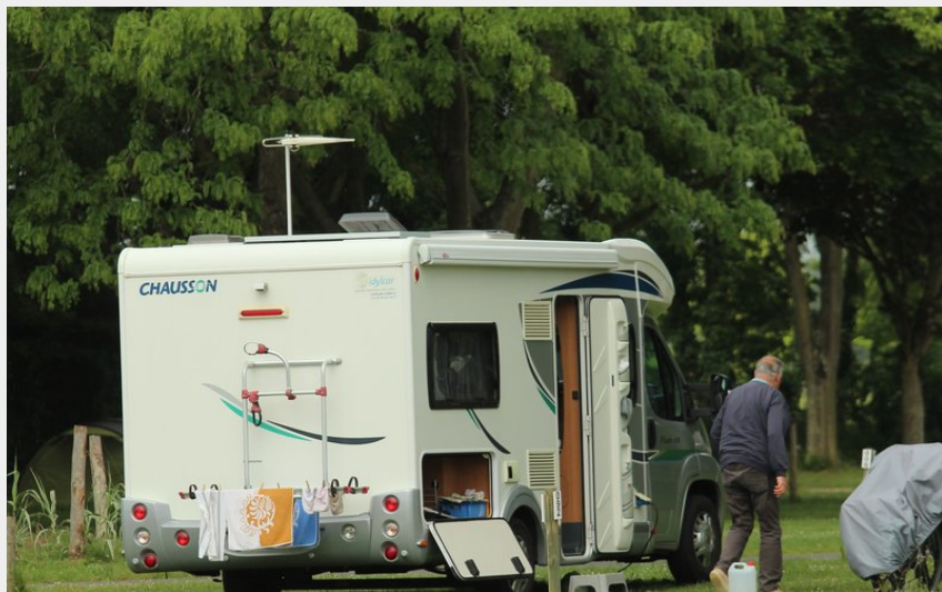
Crédit photo : emplacements Camping-cars (camping des Rives du Douet)