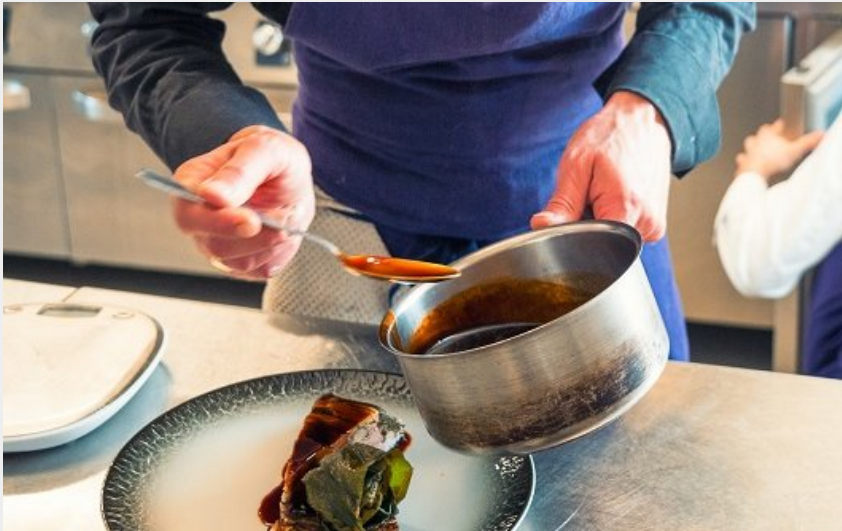
Crédit photo : Les Jardiniers - Restaurant à Ligré (chanelkoehl.com)