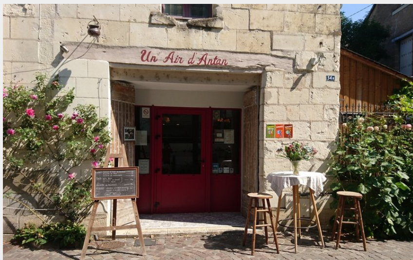
Crédit photo : CHINON-UN AIR D'ANTAN-Façade restaurant (Antoine Borgne)