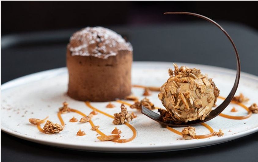
Crédit photo : chateau-hotel-avec-restaurant-gastronomique-tours (Château de Rochecotte)