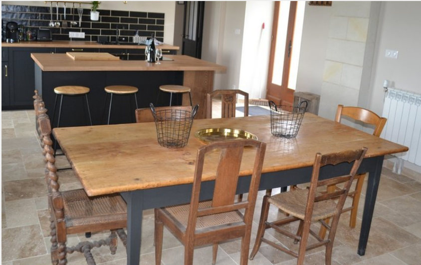
Crédit photo : CRAVANT LES COTEAUX-GÎTE DOMAINE DE NUEIL (11) (Mélanie GILLOIRE)