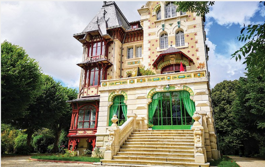
Crédit photo : Villa Alecyia - Maison d'hôtes - Sainte-Catherine-de-Fierbois (ADT Touraine)