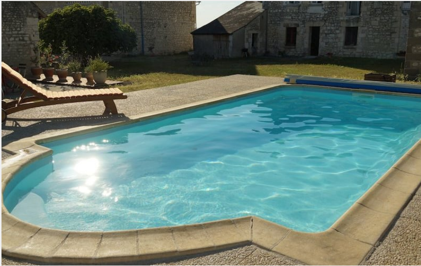
Champigny-sur-veude - Valiniere village