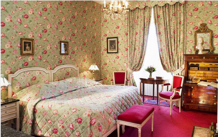
Crédit photo : Château d'Artigny - Chambre de luxe (Droits réservés)