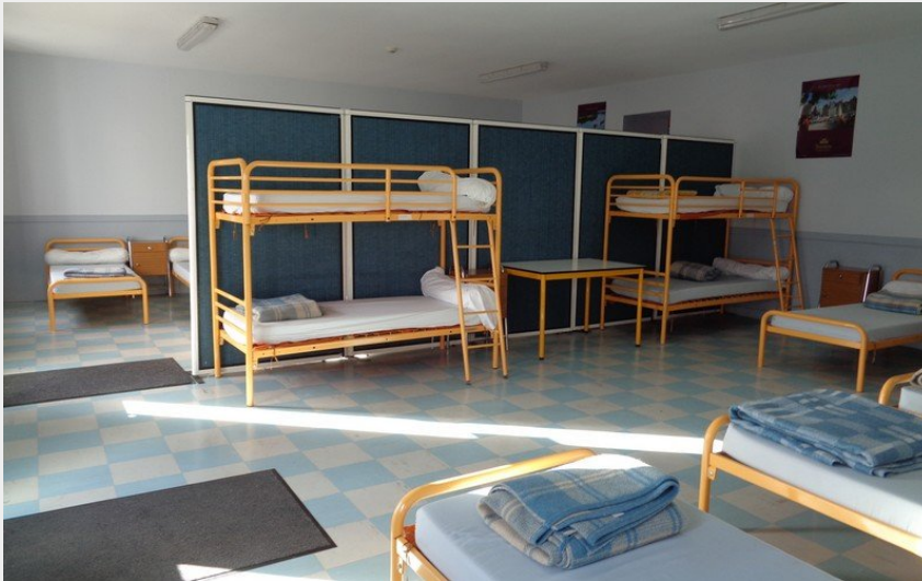
Crédit photo : GITE DE 20 PERS (1ère partie) (Gîte d'étape Bréhémont)