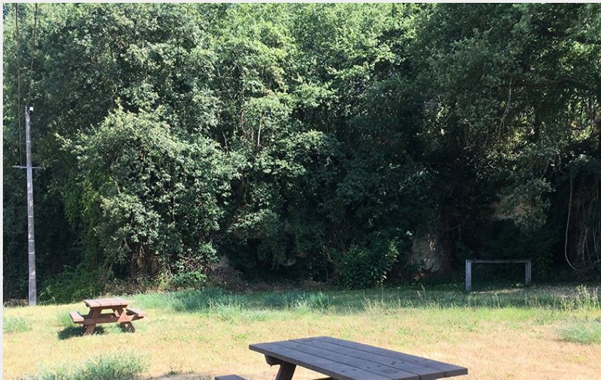
Crédit photo : table-pique-nique-parking-dive-bouteille-credit-g-lapaque (Guillaume Lapaque)