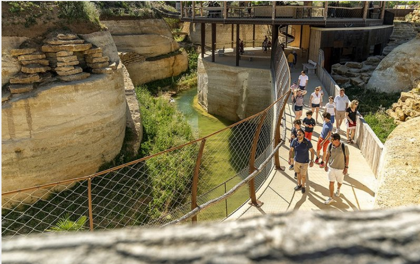
Crédit photo : 2-Crateres carnivores © Bioparc - S.Gaudard (S.Gaudard)