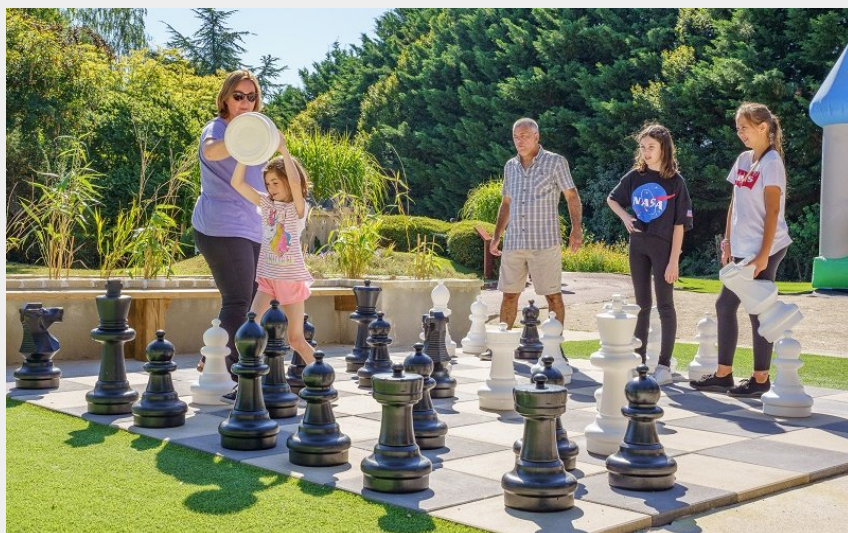
Crédit photo : Parc des mini-châteaux - Amboise, Val de Loire. (Alain Joli)