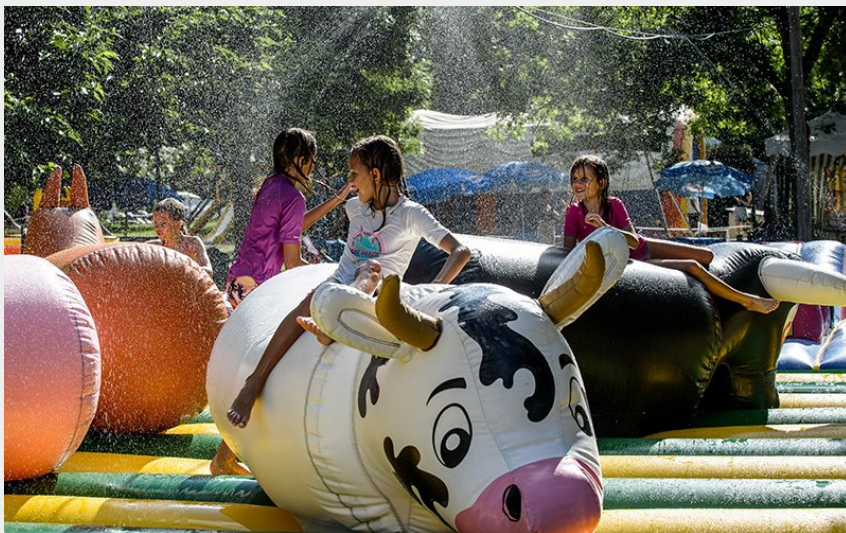
La guinguette de Lulu Parc - Rochecorbon - Juillet 2017