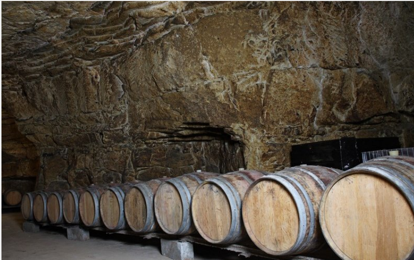
Crédit photo : domaine des geleries - cave - © Germain Meslet (© Germain MESLET)