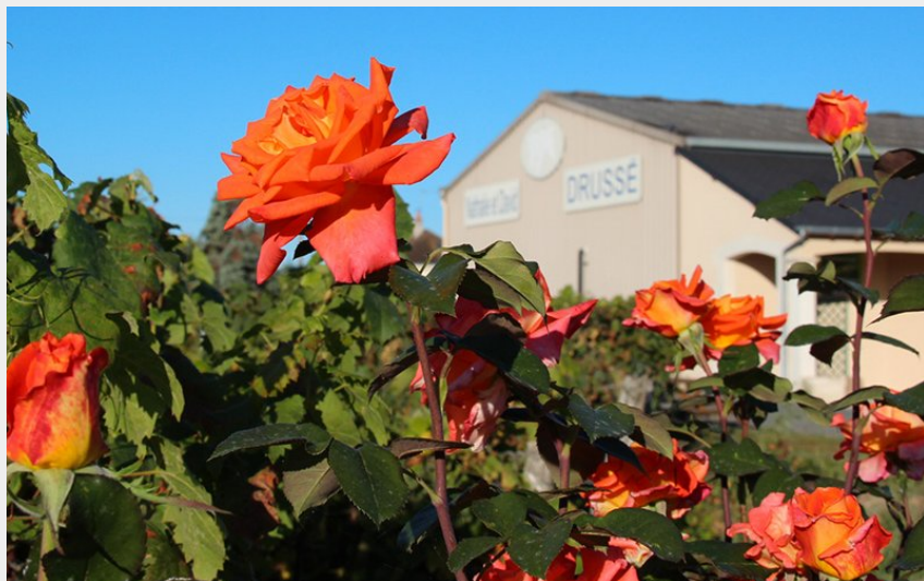
Crédit photo : Cave Drussé - Saint-Nicolas-de-Bourgueil (©Cave Drussé)