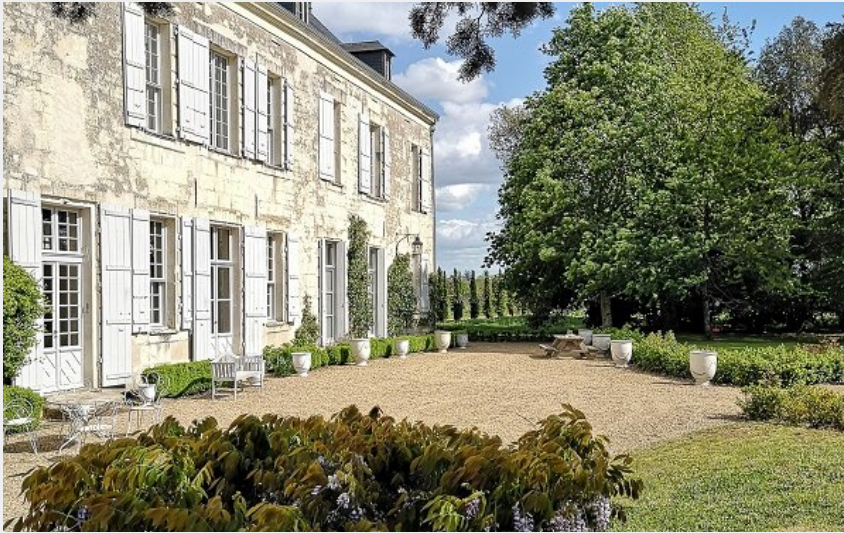
Château de Minière - Coteaux-sur-Loire