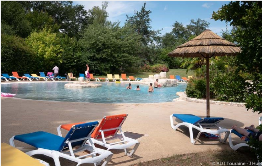
Crédit photo : Camping Parc de Fierbois - Parc aquatique (ADT Touraine / Jérôme Huet)