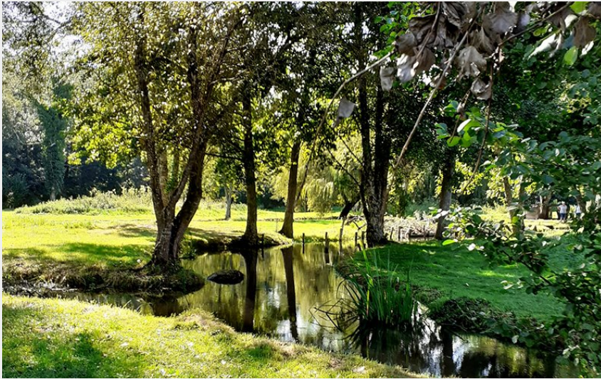
Crédit photo : Les viviers du moulin de Langeais (Les viviers du moulin de Langeais)