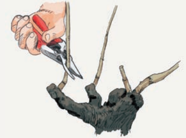
4 La taille

Réponse 1 Printemps - 2 Automne 3 Été - 4 Hiver