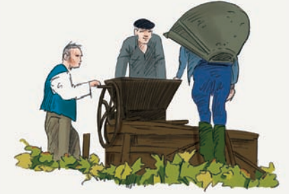
2 Les vendanges