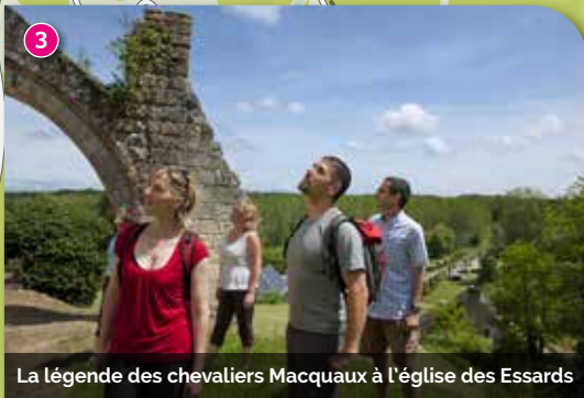
La légende des chevaliers Macquaux à l'église des Essards