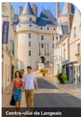
Centre-ville de Langeais