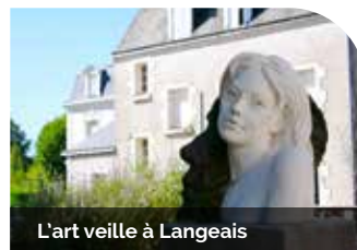
L'art veille à Langeais