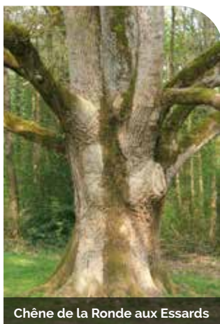
Chêne de la Ronde aux Essards