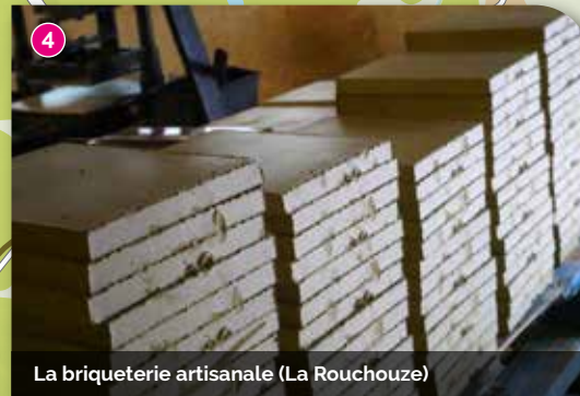
La briqueterie artisanale (La Rouchoze)