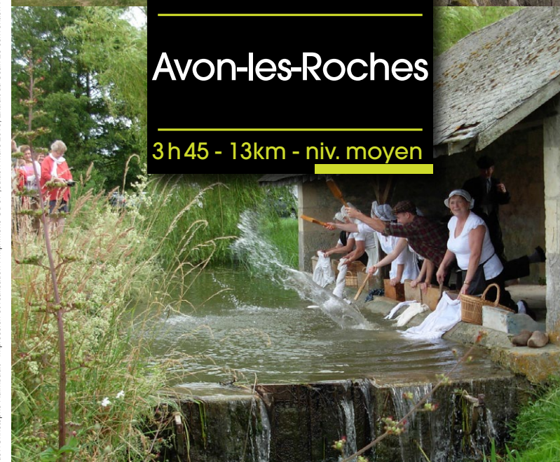
photo © Cd37/Christophe Rambaut - impression et réalisation : Impprimerie Cd 37 - édition mars 2018. Extrait du Scan 25 convention IGVN4000970 - N°200 IMPRIMERIE